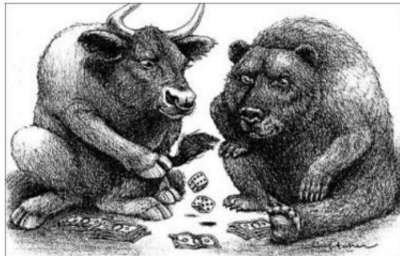
Loop ik risico op de beurs?

Als je een afkeer hebt van risico's zal je het aanbod niet aannemen. En hoe groter het bedrag is dat je kunt verliezen hoe groter de risico aversie zal zijn.